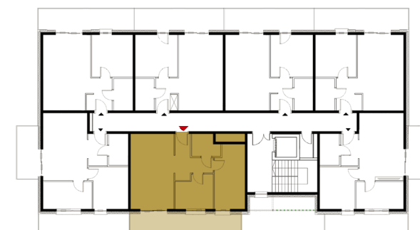
Rzut kondygnacji - 1 Piętro