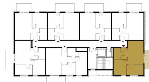
Rzut kondygnacji - 2 Piętro