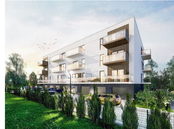
Wizualizacja frontu budynku