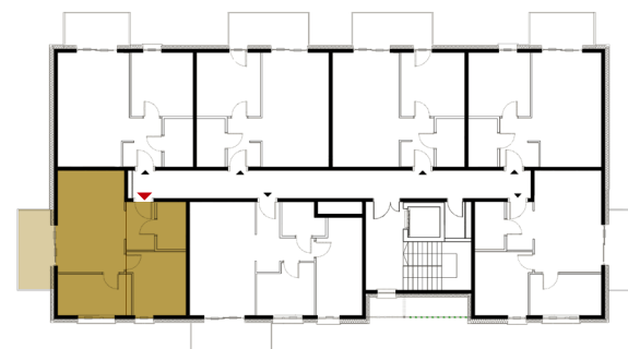
Rzut kondygnacji - 2 Piętro