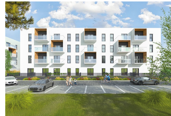
Wizualizacja frontu budynku