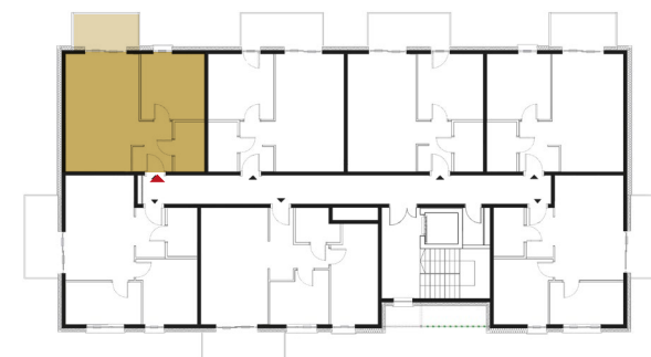
Rzut kondygnacji - 2 Piętro